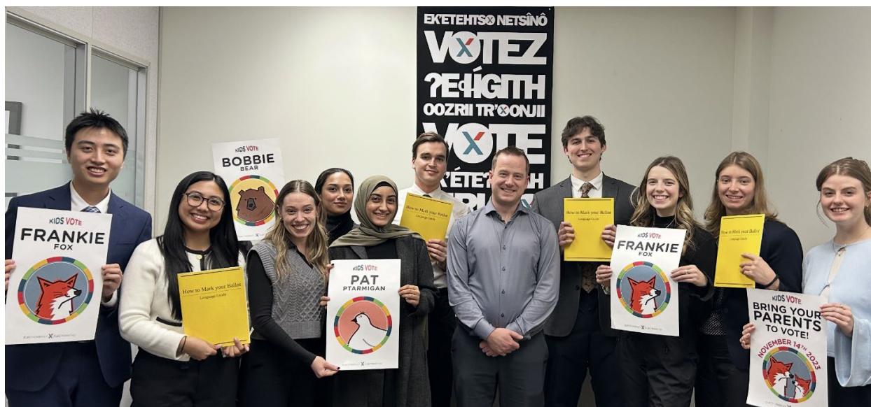
Le directeur général des élections avec les participants de l'édition 2025 du PSALO

Élections TNO a rencontré les participants des éditions de 2024 et de 2025 du programme de stages à l'Assemblée législative de l'Ontario (PSALO) et leur a présenté l'histoire de l'organisation, le mandat du Bureau du directeur général des élections, nos circonscriptions électorales, ce qui rend les TNO uniques d'un point de vue électoral, les candidats non partisans et les difficultés de tenir des élections au nord du 60 e parallèle.