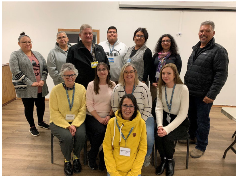
La sous-directrice générale des élections au programme des visites de la Saskatchewan

La sous-directrice générale des élections a participé au programme de visites pendant la semaine de vote. Elections Saskatchewan proposait deux programmes de visites, l'un pour les centres urbains et l'autre pour les collectivités autochtones. C'est celui que la sous-directrice générale a choisi de suivre. Cela a été l'occasion de rencontrer des dirigeants des Premières Nations et des membres du personnel électoral autochtone, en plus