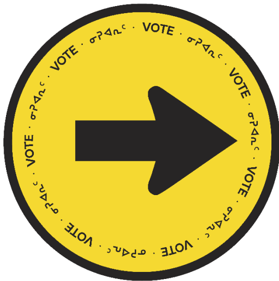
Flèche directionnelle inuktitute