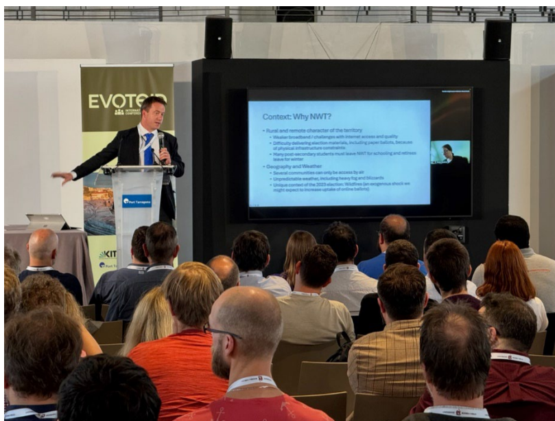
Présentation du DGE à la conférence internationale E-Vote ID