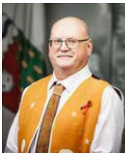
Shane Thompson Président de l'Assemblée législative des Territoires du Nord-Ouest

A stylized handwritten signature in black ink.