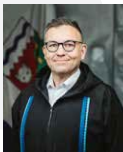
Glen Rutland Greffier de l'Assemblée législative des Territoires du Nord-Ouest

A stylized handwritten signature in black ink.